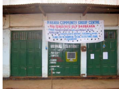
Facade af bygning