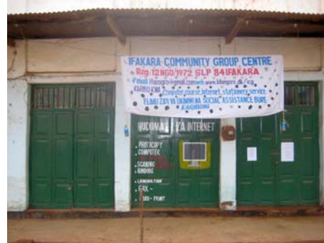
Facade af bygning